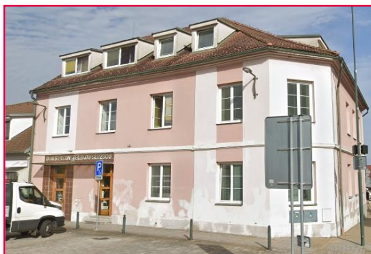
Náměstí 5. května 125