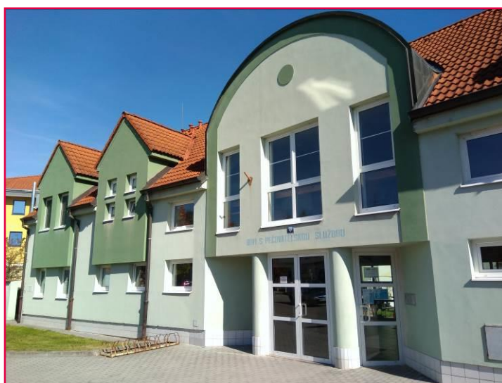
Svatopluka Čecha 20