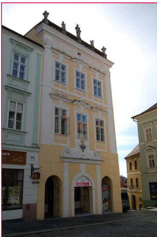
Náměstí Míru 174