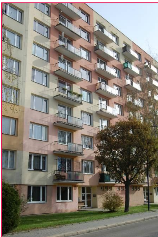
Sídliště U Nádraží 791