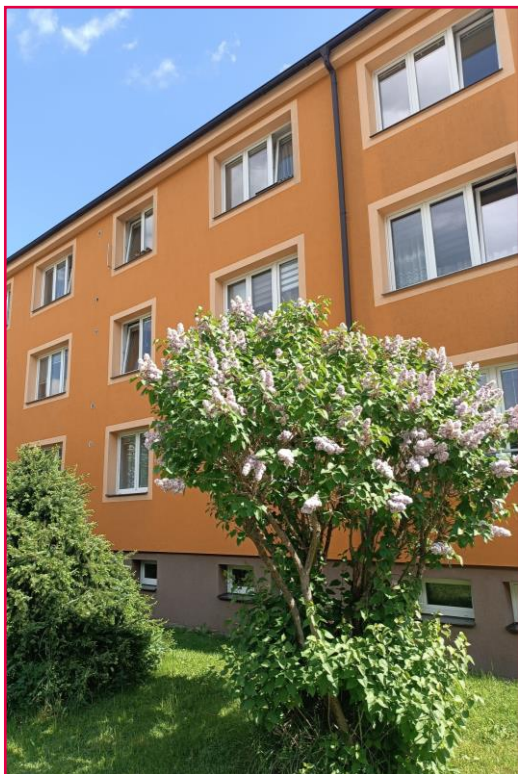
Sídlíště U Nádraží 738